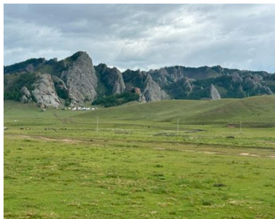
(テレルジ国立公園)

そんな草原の中に高さ30メートルのチンギスハーンさんの像がそびえたっております。明の国に敗れ、今の国土となってしまいましたが、その繁栄ぶりは凄かったのでしょうか。